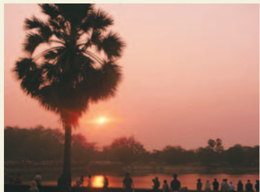
アンコールワットの日の入り