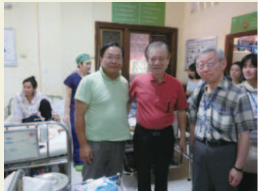
外科病棟で、筆者、蒲池会長、藤田先生