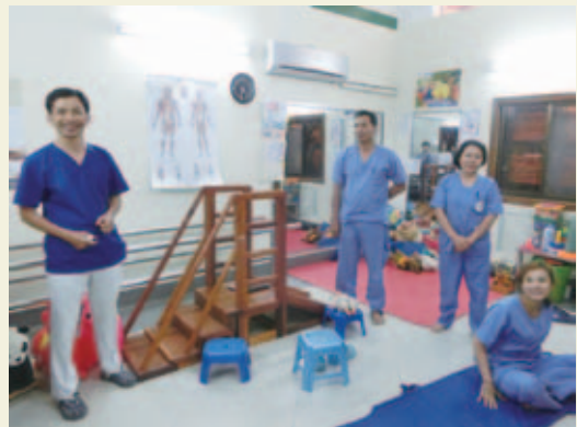
小児用のリハビリ室