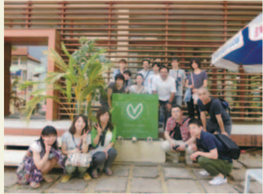
巨樹の会グループ病院からの参加者

そして現在では20人の研修医をはじめ、多くの小児医師、看護師を教育してカンボジアの小児医療を支える拠点として活躍しています。